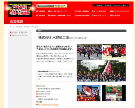
ジャンル別に、1会員1ページでご紹介します

※希望される会員様には別途原稿をご用意いただきます (文字数・写真点数等につきましては規程があります)